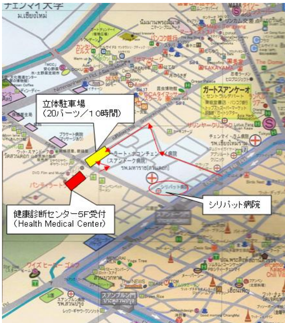
赤印:健康診断センター(受付場所)